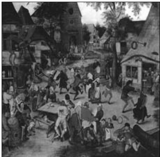
Pieter Brueghel de jonge (Litérature G.Marlier, Brussel 1967)

Een schilderij van Pieter Brueghel de Jonge toont het beugelspel tijdens de St.Joriskermis.