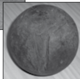
Beugelbol Quebrachohout Ø 145 mm 1890-1910.