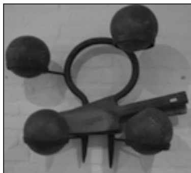
Houten beugelbollen uit 1935. Op de beugelbaan van de Flatsers Baarlo Ø 120 mm