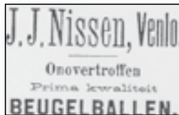
Advertenties uit de Maas en Roerpost en uit De nieuwe Koerier 1875-1900