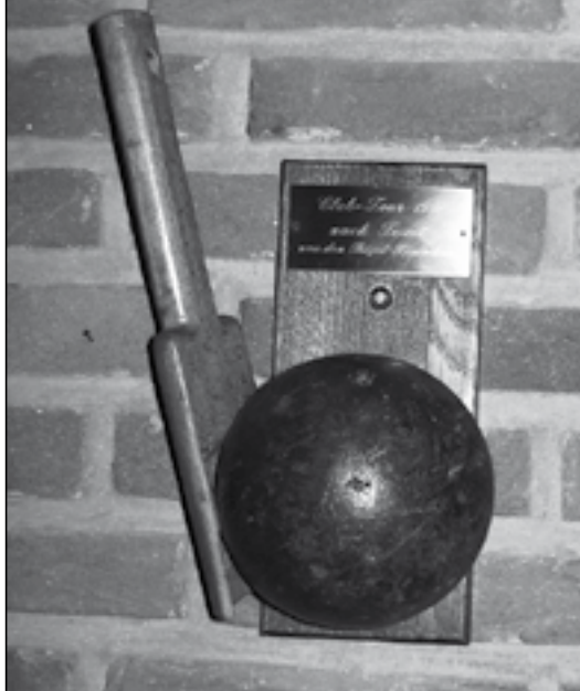
De hier afgebeelde bol is afkomstig van de 'Pastoratshof' (anno 1680) in Grefrath Duitsland. De ouderdom van deze bol is niet met duidelijkheid aan te geven.