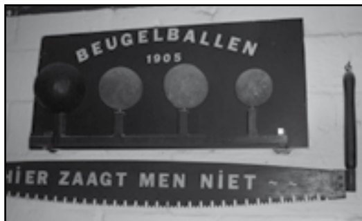
Houten beugelbollen, ruim 100 jaar oud, op de beugelbaan van Voorshoven België