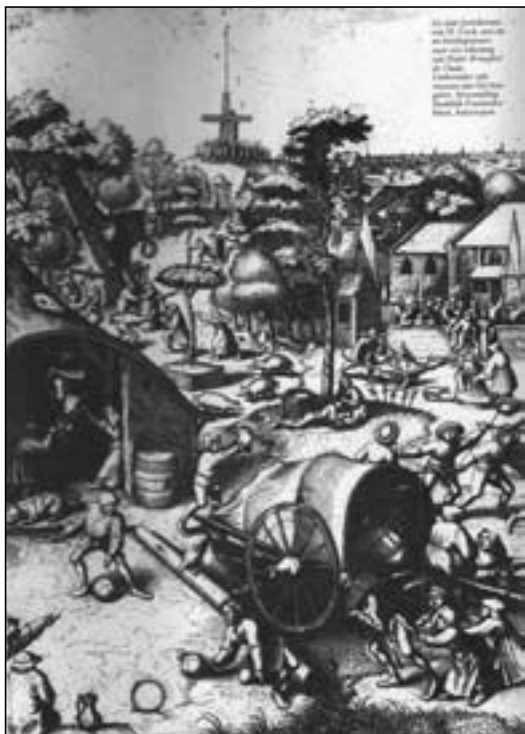
De Sint-Joriskermis van H.Cock, een ets en burijngravure. Verzameling, Stedelijk Prentenkabinet, Antwerpen

Het beugelspel wordt gespeeld met vier ballen die in het officiële spelreglement consequent bollen worden genoemd. De bollen zijn immers massief en niet gevuld met lucht zoals bijvoorbeeld een voetbal. Onder de beugelvaarders is het veel populairdere woord 'ballen' in gebruik. De houten bollen hadden vroeger een doorsnee van 14 tot 23 cm en een gewicht van \pm 2.5-4 kg. In de jaren na 1950 begint men te experimenteren met allerlei soorten kunststof. Tegenwoordig worden alle bollen van kunststof gemaakt.