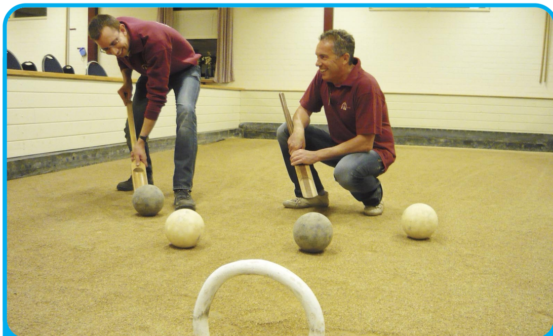
Tijdens de open dag van 12 september wil de vereniging mensen kennis laten maken met de sport. Een vrijblijvende introductie waarbij de bezoekers onder begeleiding het spel ook zelf uit kunnen proberen en de basisbeginselen worden bijgebracht.

Dit jaar is de bond begonnen om het beugelen populairder te maken en onder de aandacht te brengen. Ten onrechte heeft de sport buiten Limburg een stoffig en oubollig imago. Volkomen onterecht: beugelen is een tactisch steekspel gecombineerd met fysieke vaardigheden. Het is een kwestie van anticiperen, vooruit denken, en natuurlijk de goede ballen op de goede momenten spelen. Teveel mensen kijken neer op het beugelen terwijl dat niet zou mogen. Daarom wil de Nederlandse bond het spel promoten met onder andere een nieuwe website en een samenwerking met het voetballen. Hoewel dit laatste in eerste in-