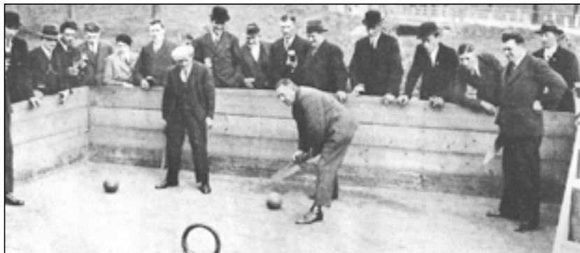
Beugelbaan Roermondsche Weerd (in 1935 nationale Bondsbaan)

Ook in meer noordelijk Limburg worden steeds meer beugelclubs opgericht. Op 21 februari 1935 wordt een eerste vergadering belegd om te komen tot een eigen beugelbond. Omdat de aanwezigen niet gerechtigd zijn een besluit te nemen voor hun verenigingen, volgt op 14 maart 1935 in het clublokaal van De Kuiters in Tegelen de officiële oprichtingsvergadering en de Noord-Limburgse Beugel Bond is hiermee een feit. Afgevaardigden van Reuver en Belfeld houden nog een vurig pleidooi voor aansluiting bij de Midden-Limburgse Beugelbond, tevergeefs.